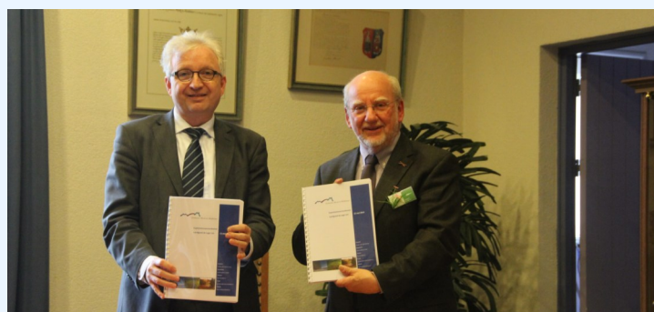
15 Mei Ondertekening anterieure overeenkomst