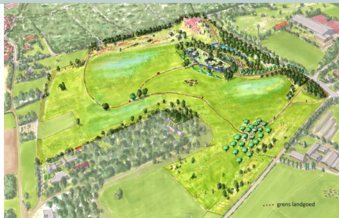
*Vogelvlucht impressie over het landgoed. Met de aansluiting van de zuidelijke 2,5 ha vormt het gebied een logisch geheel.

Nu de aankoop van de 2,5 ha. gemeentegrond afgerond is en de bestemmingsplanwijziging onherroepelijk is, zal ook het zuidelijke deel van het Landgoed onder de Natuurschoonwet (NSW) worden gerangschikt om het 15 ha. omvattende Landgoed De Lage Lier als compleet NSW-gebied aan te kunnen duiden. Dit open deel van het Lierdal, op de flank van de stuwwal, wordt daarmee duurzaam behouden met verbeterde kansen voor landschap en natuur. Men kan er in de toekomst wandelen en genieten van de afwisseling, en verscheidenheid van het gebied, op een manier die eerder nog niet mogelijk was.